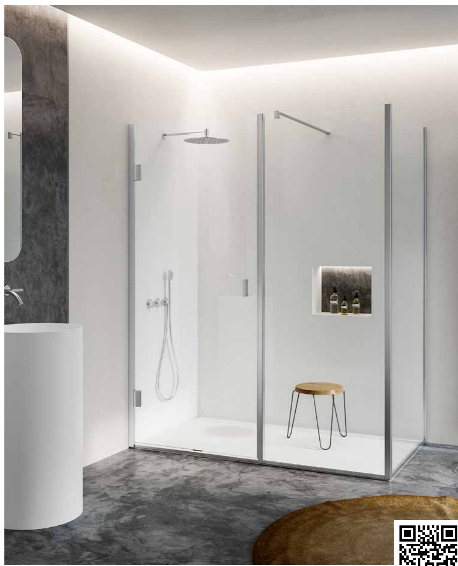
OUVERTURE AVEC PORTE BATTANTE. EN PHOTO VERSION EN ANGLE, MODÈLE DROIT AVEC BOUTON À DROITE ET CÔTÉ FIXE DANS L'ANGLE À DROITE, FINITION ACIER INOXYDABLE SATINÉ.

Extensibilité ± 0,5 cm de la mesure indiquée sur la confirmation de commande